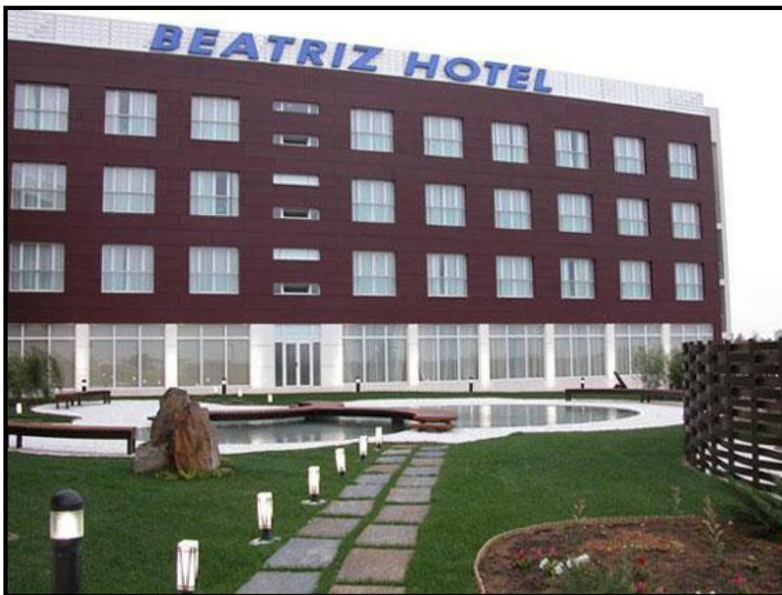
Hotel**** Beatriz Albacete.

Los precios que se han negociado con el hotel son los siguientes: